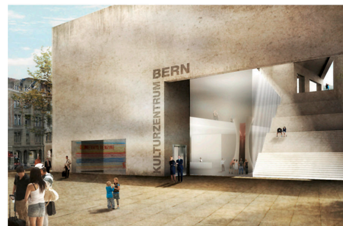
Eine Gebäudeidee des Siegerprojekts: Das Kulturzentrum mit einem «City Window» am Ort der heutigen Schützenmattrasse.