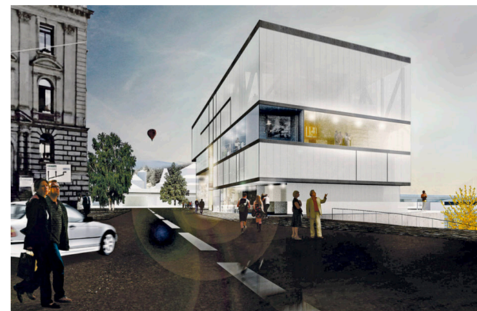
In dieser Drogenanlaufstelle gäbe es auch Platz für eine kulturelle Nutzung. Idee aus dem zweitplatzierten Projekt.