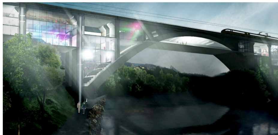
Das Projekt «Bridging Barriers», ebenfalls aus Berlin, landete auf Rang 2. Es sieht vor, dass der Eisenbahnviadukt vom Boden her aufgefüllt und die neu entstandenen Räume genutzt werden.