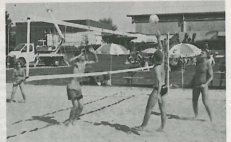
Voller Einsatz beim Beachvolleyball-Turnier.