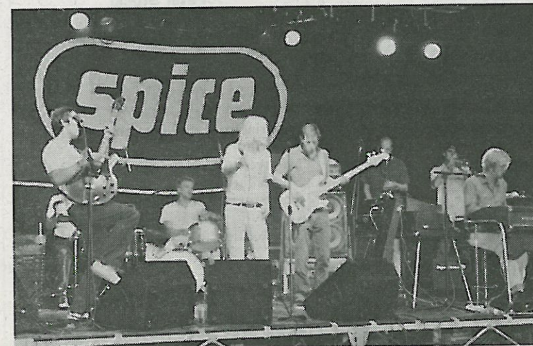
«Spice» heizte mächtig ein.