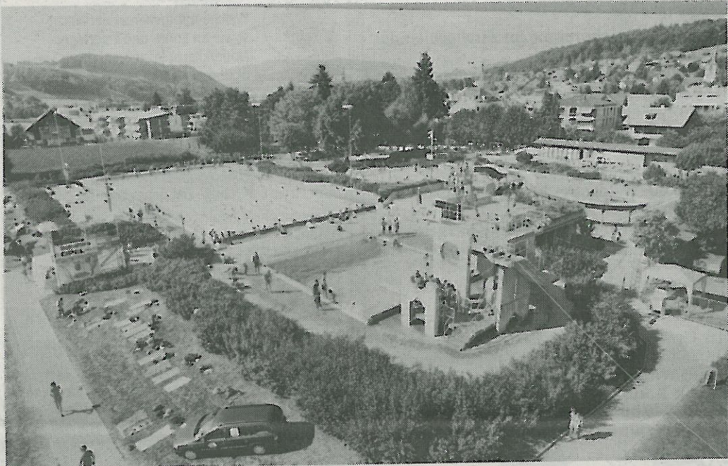
Die Badi Worb aus der Vogelperspektive.