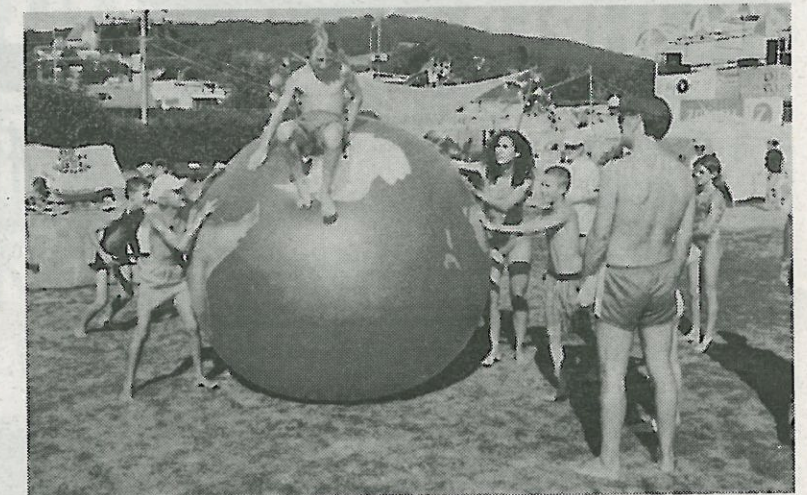
Spielen mit dem Erdball.